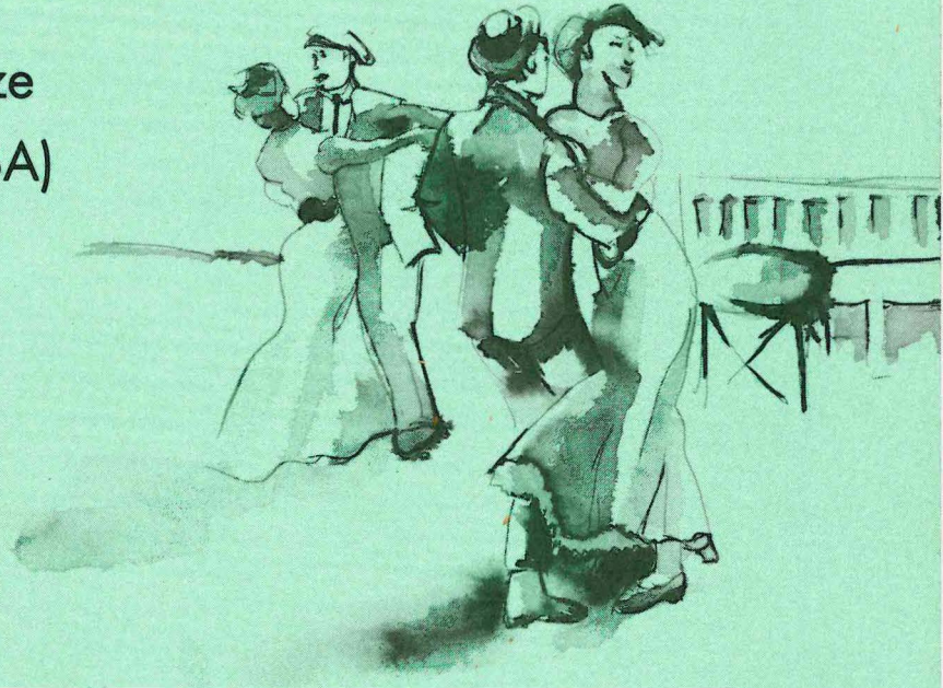
Illustration: Markus Bogena